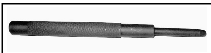
Valve Guide Remover (P/N 529 036 086)